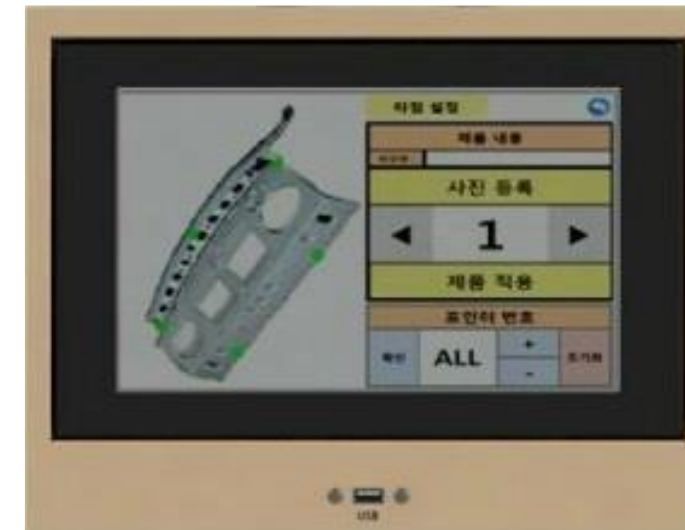
[Weld Data Screen]