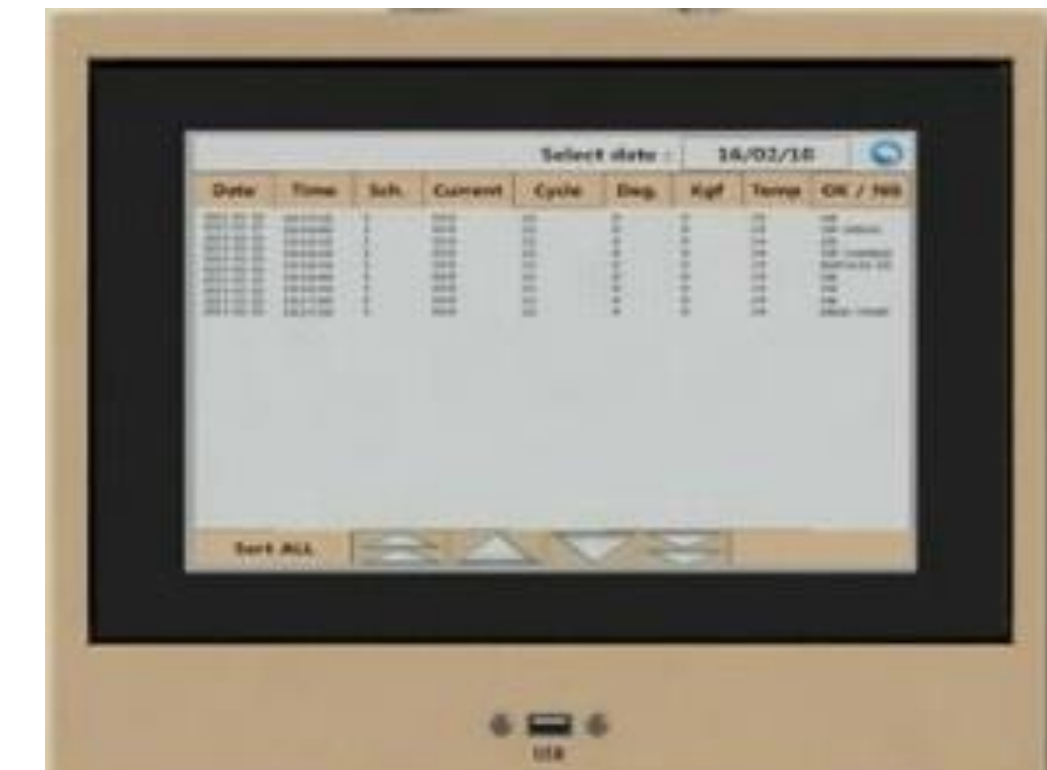
[Product Setting Screen]